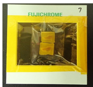
図1: ラット舌癒痕組織のパラフィン包埋ブロックを撮影用に固定したもの