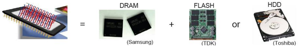
図2 レーストラックメモリの概念図