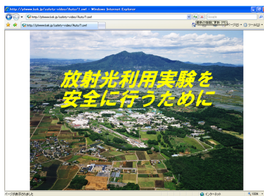
図 2.FLASH 版安全講習ビデオ