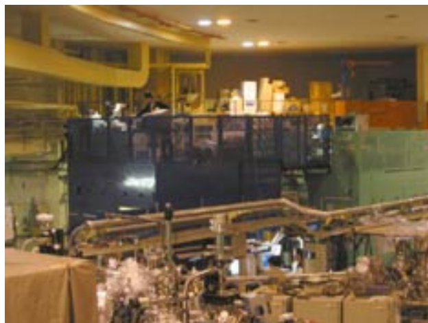
KEKの放射光実験施設