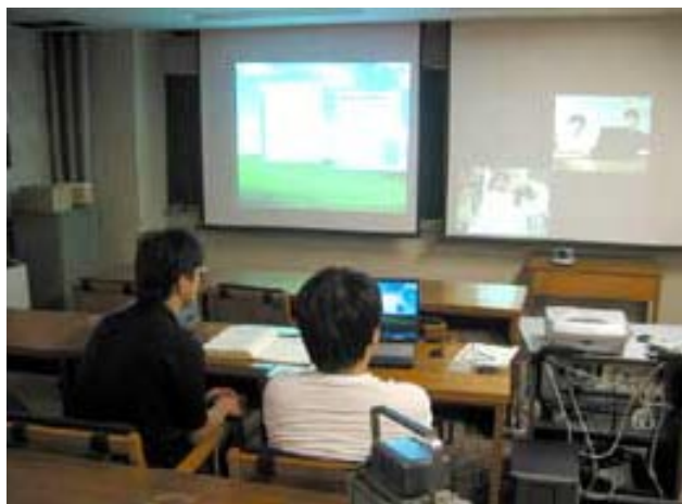
岡崎の分子科学研究所での操作風景

コラボラトリー計画に参加しているのは、東北大学金属材料研究所、東京大学物性研究所、岡崎国立共同研究機構・分子科学研究所、京都大学化学研究所、それに高エネルギー加速器研究機構・物質構造科学研究所の5つの機関。この研究開発は科学研究費補助金（学術創成研究費）で平成13年から5年間行われる。