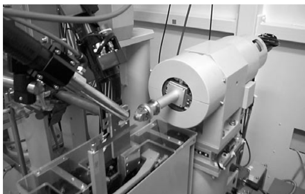
サンプル周り概観

ビームの出射位置は、10 keV ~ 15 keV のエネルギー範囲では水平垂直方向ともに 40 \mu\text{m} 以内に納まっていますが、それ以外のエネルギーでは最大 100 \mu\text{m} ほど外れます。さらに光学系の調製をして、再アライメントなしで波長変更可能にする予定です。