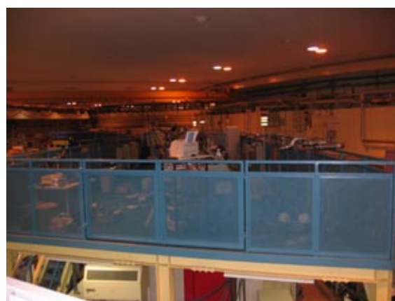
図1 旧 BL-17 (2月28日撤去前)

前号で紹介したように, 放射光科学研究施設では, BL-17 に新しい構造生物学研究用ビームラインを建設している。これまでのところ建設作業は順調に進んでいる。まず, 2月28日朝の PF リング停止直後に, 旧 BL-17 の解体作業を開始し (図 1), 3月10日には撤去を完了した (図 2)。その後新 BL-17 の建設を開始し, 3月末までにメインハッチ, 光学ハッチ, デッキ部が完成した (図 3)。4月1日現在, 実験ハッチやコントロールキャビンの建設準備, 分光結晶冷却装置やデータ測定システムの調達, ビームライン測量等の作業を行なっている。今後は, 4月中に電気工事を終え, 5月からはビームライン光学系の設置を行ない, 6月に実験ハッチ及びコントロールキャビンの建設を行なう予定である。秋のファーストビーム導入に向けて着々と準備が進んでいる。