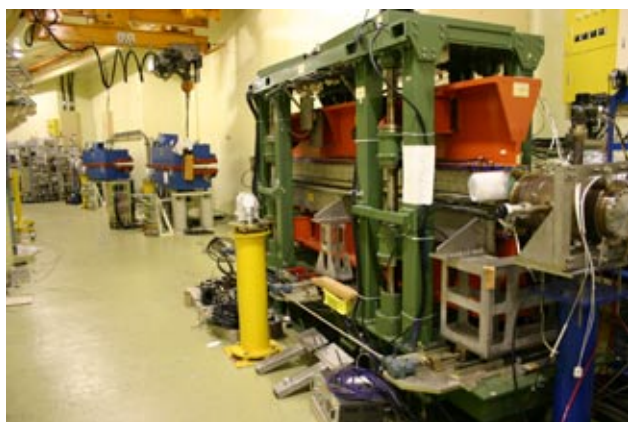
写真3 四極電磁石とビームダクトが撤去されたリング内、MPW#16からその下流部をのぞむ。後方に見える2台の偏向電磁石の間に短直線部が新設され、短周期アンジュレータが設置される。