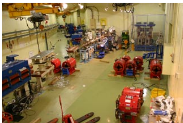
写真2 MPW#28 付近、四極電磁石および架台の搬出作業。電磁石の搬出通路を確保するためMPW#28はリングから切り離して退避中(写真右奥)。

光源などの重量物を運搬します。運搬経路を確保するためMPW#28を真っ先にリングから切り離して退避させました。写真1はMPW#28移動直前の付近の様子。写真2はMPW#28移動後の通路を通して四極電磁石を運び出している最中の画像です。3月末の段階で作業は順調に進行しており、電磁石とビームダクトの搬出作業はすべて完了し、リング内の直線部は写真3,4に掲げたように挿入光源と偏向電磁石のみが残された状態となっています。