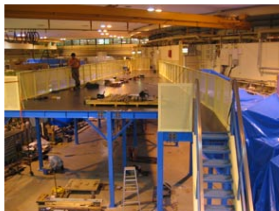
図3 現在の BL-17 (デッキ完成, 3月25日)