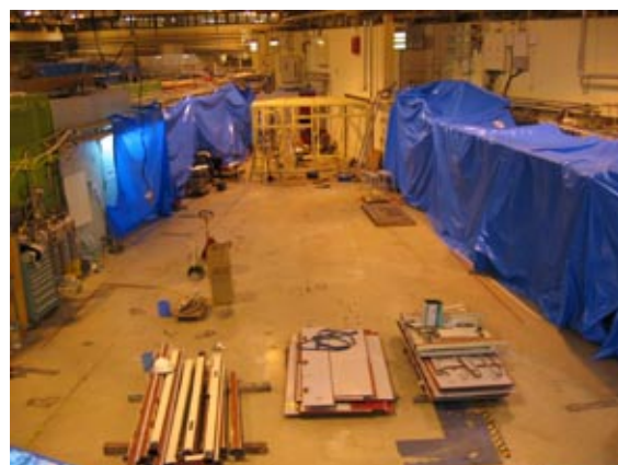
図2 BL-17 撤去終了 (3月10日)