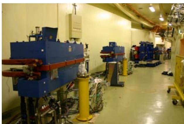
写真4 四極電磁石とビームダクトが撤去されたリング内、U#2(右奥)の直下流付近。偏向電磁石の右横のポストはアライメント用基準ポスト。

しい四極電磁石の搬入、設置が予定されています。新しい四極電磁石は昨年度中にすでに磁場測定を終え電源棟でスタンバイしています。また新しいビームダクトは光源棟の地下機械室においてインストール前の真空焼き出しが行われています。この記事が配布される頃には四極電磁石の搬入、設置が完了し、新しいビームダクトの設置もおおむね完了するまで作業が進んでいるものと思われます。BL17とBL27の2本の基幹チャンネルの新規設置作業も6月中に完了する予定です。