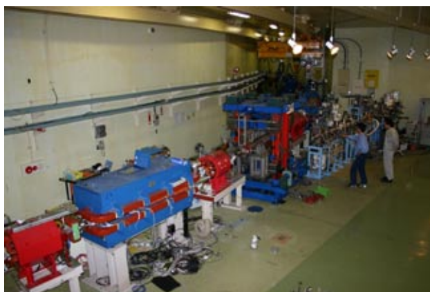
写真1 MPW#28 付近、MPW 移動直前の様子。BL-27 基幹チャンネルの真空ダクトを取り外したところ。